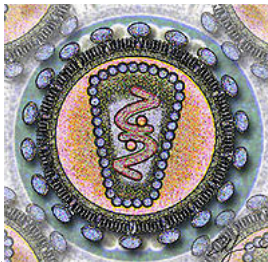
Tra le modalità di rapporti sessuali, quello anale viene considerato più a rischio di infezione. Ciò perché la funzione di barriera dell'intestino nella zona anale è piuttosto bassa, essendo quest'ultimo costituito da una membrana piuttosto sottile. Sia HIV-1 che HIV-2 sono in grado di infettare le cellule che presentano sulla loro membrana il recettore CD4. Al fine dell'ingresso nella cellula CD4 da solo è insufficiente ed il virus si deve legare ad un altro recettore. Queste ultime sono molecole appartenenti alla famiglia dei recettori con sette domini transmembrana accoppiati con la proteina G.

Il primo dei due è prevalentemente localizzato in Europa, America ed Africa centrale. HIV-2, invece, si trova per lo più in Africa occidentale ed Asia e determina una sindrome clinicamente più moderata rispetto al ceppo precedente.