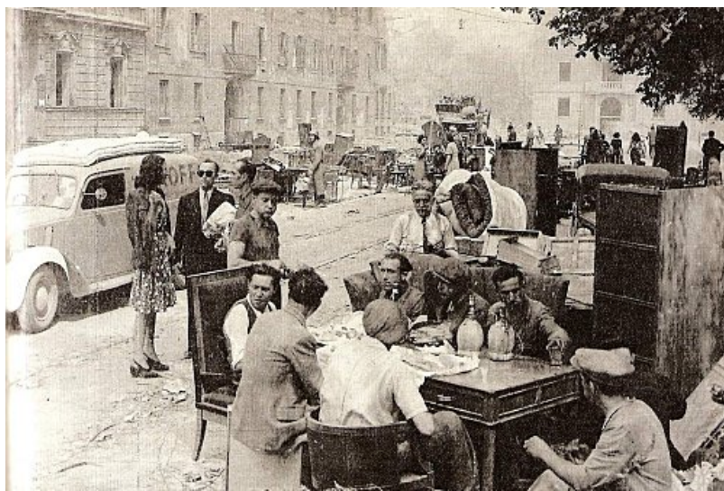
all'estate del 1942. Nel marzo del 1943 un episodio ancora in parte misterioso, fu l'esplosione della Caterina Costa una nave mercantile di 8.060 tonnellate.

Nel 1940 si ebbero sull'Italia le prime incursioni aeree da parte degli inglesi che, si sarebbero potuti giustificare come reazione alla barbarie germanica dei violenti bombardamenti della Luftwaffe (la forza aerea tedesca), da fonti storiche ben accreditate sembra che il primo bombardamento notturno su obiettivi non militari fu fatto dagli inglesi nel maggio 1940 sulla meravigliosa città di Friburgo.